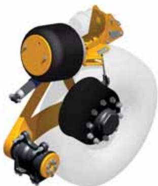
标准LV-O独立空气悬挂单元