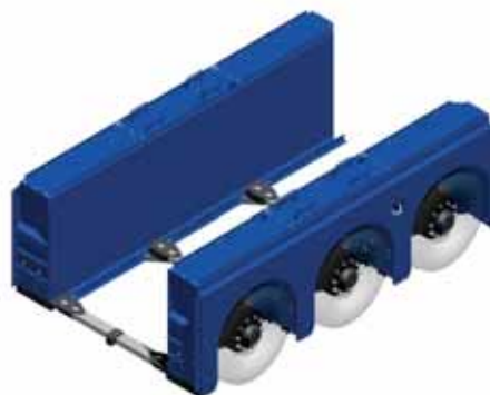
选配轮箱的LV-O独立空气悬挂系统